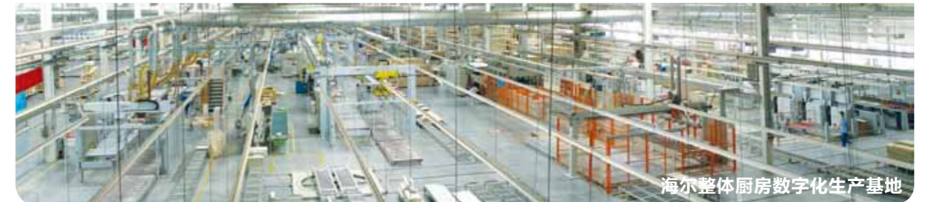
海尔整体厨房数字化生产基地

◎海尔厨房设施有限公司隶属于海尔集团，成立于 1997 年，以雄厚的研发、生产及家电配套实力，业已发展成为亚洲最大的整体厨房企业之一。