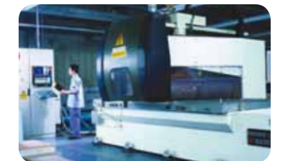
海尔 / 镂花和吸附