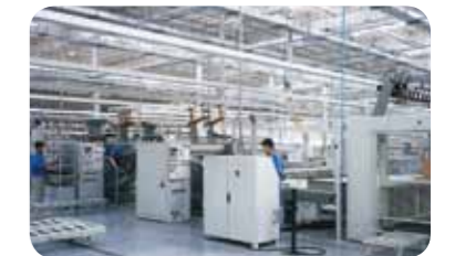
海尔 / 钻孔线

德国贝高公司的防火板贴面专用线，有静电除尘和智能压贴功能，使贴面积压力均衡分布。