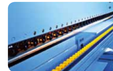
海尔 / 封边机

亚洲最大的纵横锯切中心，可同时切割 7 块板材（板材厚度为 18mm），加工精度可达 0.1mm，气悬浮式板件输送防止板件表面划伤。