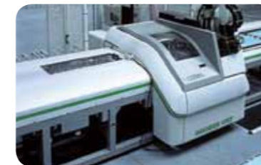
海尔 / 门铰链加工中心

德国 HOMAG 公司生产，采用 NC21 型计算机控制系统，豪迈图灵控制系统，最大铣深 40mm