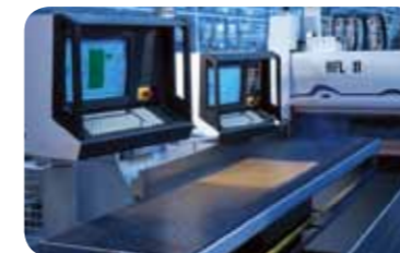
海尔 / 纵横锯

◎2011 年，海尔品牌价值达到前所未有的近千亿，海尔整体厨房亦结合中国国情率先提出“橱柜家电一体。服务一站满意”，以新思路、高起点的系列产品开辟广阔市场，创造骄人业绩。在商机与危机并存的大市场中，海尔整体厨房诚邀您互惠发展，同创伟业！