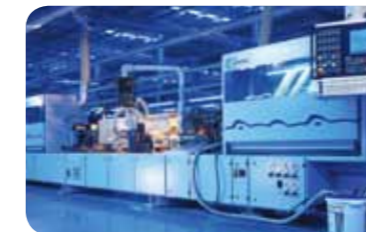
海尔 / 后成型生产线

德国 HOMAG 公司生产，采用 NC21 型计算机控制系统，豪迈图灵控制系统，最大铣深 40mm